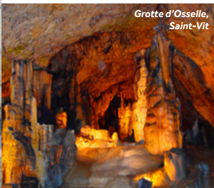
Grotte d'Osselle, Saint-Vit