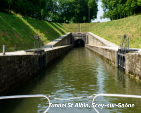
Tunnel St Albin, Scey-sur-Saône