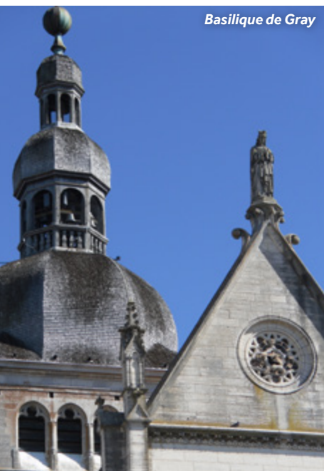
Basilique de Gray