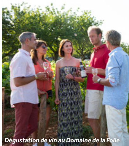
Dégustation de vin au Domaine de la Folie