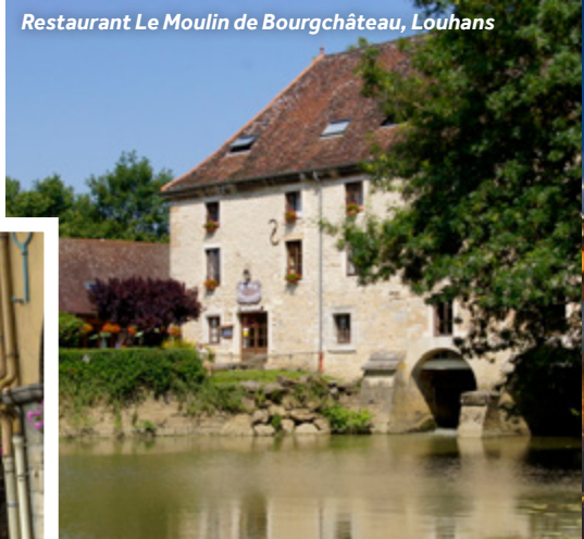
Restaurant Le Moulin de Bourghâteau, Louhans