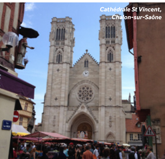
Cathédrale St Vincent, Chalon-sur-Saône