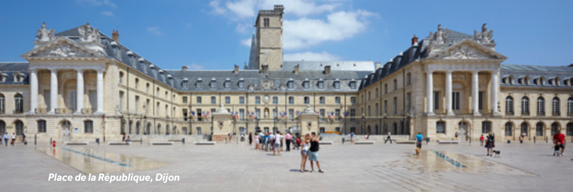
Place de la République, Dijon