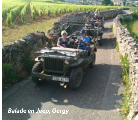
Balade en Jeep, Gergy

Commerces : épicerie, boulangerie, boucherie, café.