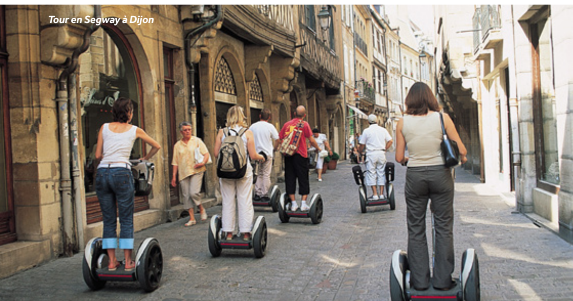
Tour en Segway à Dijon

Port : eau, électricité, sanitaires, douches, laverie, wifi.