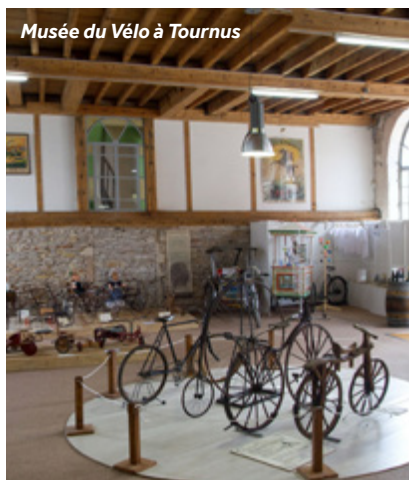
Musée du Vélo à Tournus