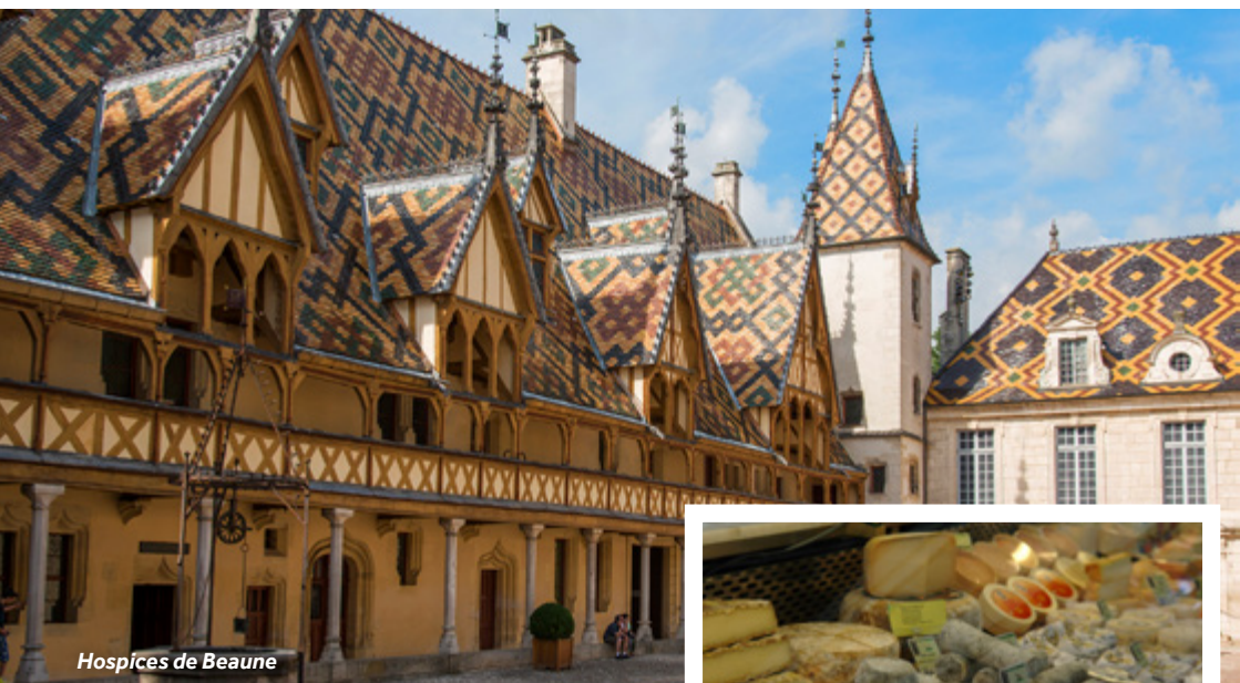
Hospices de Beaune