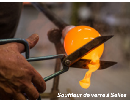
Souffleur de verre à Selles

Base Le Boat : eau, électricité, wifi, ainsi que douches et toilettes quand la base est ouverte.